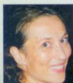
Γράφει η ΔΟΜΝΑ ΕΥΑΓΓΕΛΙΔΟΥ

Το χαμόγελο μπορεί να χαρακτηριστεί και ως καθρέφτης της προσωπικότητας του ανθρώπου. Υπάρχουν όμως περιπτώσεις ανθρώπων που διστάζουν να χαμογελάσουν λόγω αισθητικών προβλημάτων στα μπροστινά τους δόντια, φυσικά ή τεχνητά. Είναι ένα πρόβλημα που μπορεί πλέον εύκολα να λυθεί.